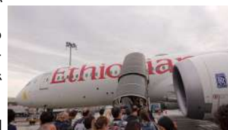
↑エチオピア航空でジンバブエへ

今回の出張は7月24日から30日までの1週間でした。乗り継ぎを繰り返して、ジンバブエに到着するまでに24時間もかかりました。実際に滞在できたのは7月25日から27日までの3泊4日と短期間でしたが、その数日間でも充実した時間を過ごすことができました。