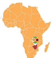
↑ジンバブエの位置

今年、猪苗代湖はラムサール条約湿地リストに登録され、「特に水鳥の生息地として国際的に重要な湿地」として認められました。ラムサール条約はユネスコの枠組みの一部であり、この湿地リストは、世界中の湿地保護に取り組む約172カ国からなる「ラムサール条約の締約国」によって管理されています。今年7月末には会議が開かれ、条約の改定や新たに指定された湿地の認定、情報共有などが行われました。私は幸運にも、会津若松市の代表者の通訳として、この会議に参加することができました。