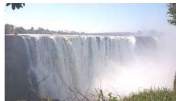
↑ヴィクトリアの滝

会議自体は7月23日から31日まで、ジンバブエのヴィクトリアフォールズで開催されました。ジンバブエはアフリカの南東部に位置し、ザンビア・モザンビーク・南アフリカ・ボツワナとの国境を接しています。日本との時差は8時間。北西部にある世界遺産「ヴィクトリアの滝」は、世界最大の滝とも呼ばれ有名な観光地です。