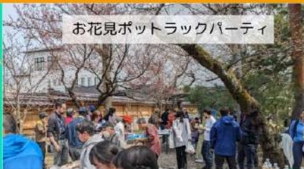
お花見ポットラックパーティ