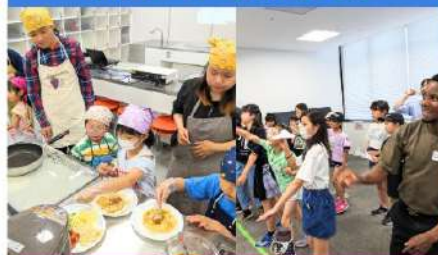
市内小学生対象の遊びを通じた国際理解・英語クラス。(全5回)