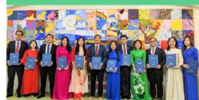
ベトナムの青年たちを対象に、地元資源を活用した産業振興について研修を行いました。