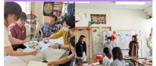
中国語で話す場所を作りたいという思いから始まった交流サークルです。中国茶、中国語五七五、春節など季節ごとの体験を楽しみました。(全4回)