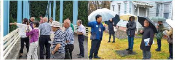
只見沿線エリア、天鏡閣・しづき氷 (天神浜) 等にてガイドナレーション作成などを学ぶ研修を行いました。