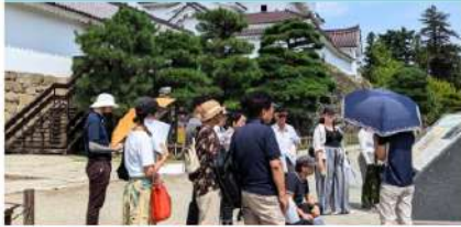
鶴ヶ城で、語学ボランティアに興味のある方に向けて研修会を実施しました。