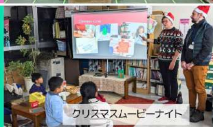
クリスマスムービーナイト