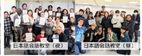
日本語会話教室 (夜)