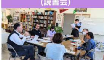
葵高校の生徒が企画した読書会です。2言語以上で翻訳された本を持ち寄って交流しました。