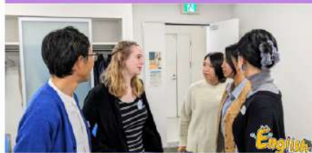
高校生が実践的な英語力を身につけたいと立ち上げたサークルです。年齢・国籍を問わず、様々な方が交流しています。(全12回 毎月第3土曜日)