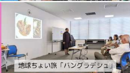
地球ちよい旅「バングラデシュ」