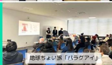
地球ちよい旅「パラグアイ」