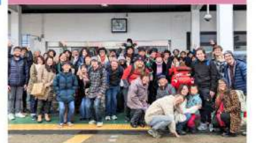
アメリカのノースカロライナ大学生のホームステイを実施しました。