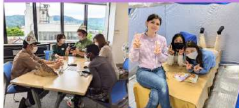
やさしい日本語で交流するサークルです。折り紙のカブト作り、かき氷、玉入れ、ちぎり絵、防災などの、日本文化体験を行いました。(全6回 2ヶ月に1回)