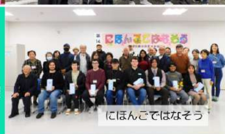
にほんごではなそう