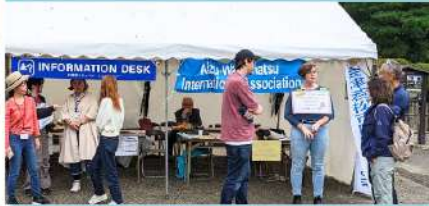
会津まつりの時期に鶴ヶ城で英語・中国語でのツアーガイドを実施しました。