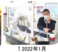
↑2022年1月 当協会事務所