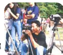
↑1999年 国際交流フェスティバル 就任して最初の大事な仕事

私は協会を通して、世界がとても身近になりました。特に相手の文化を学ぶことで、自分について考え、家族を知り、会津について知り、それによって日本を知るきっかけを得たように感じます。よその国のことではなく、自分ごととして捉えることが、協会にいると実感できるのではないのでしょうか。