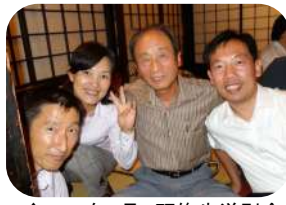
↑2014年9月 研修生送別会