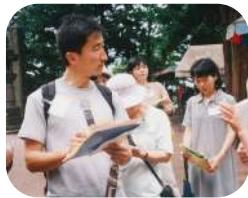
↑1998年6月 飯盛山ガイド