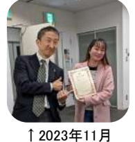
↑2023年11月 日本語会話教室