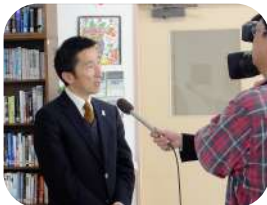
↑2013年3月 テレビ出演時