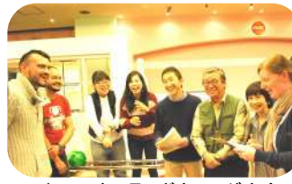
↑2016年3月 ボウリング大会