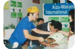
↑2004年 国際交流フェスティバル