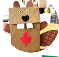
←ビーバーの パペット