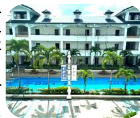
↑セブ島の学校のようす

実は、ディスカッションのクラスが一時はとても辛くて、授業を変えようと思ったこともあります。本当に泣きそうになりましたが、「フィリピンに来たのは“自分の限界に挑戦するため”で、たった1か月間で逃げるという選択肢は私に無い、ここで逃げてしまったら、この環境にいる意味がなくなってしまう」と気持ちを立て直しました。途中で諦めるのは悔しかったですし、何よりも自分に負けたくなかったのです。