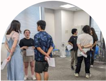
日语交流活动 あつはな