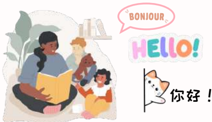
小朋友外语读书会-法、英、汉