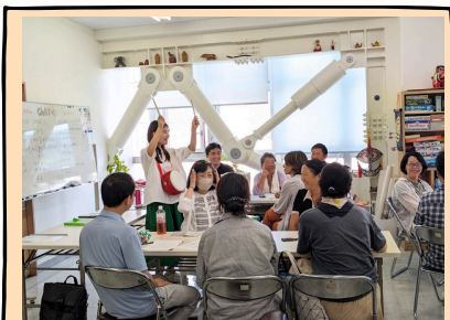
击鼓传花答题游戏!!